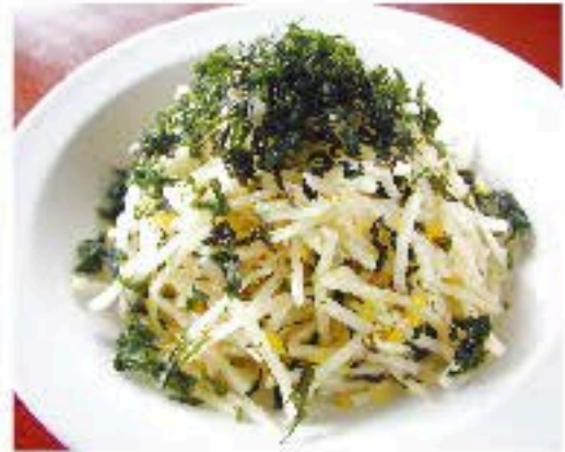
大根と岩のりのサラダ 750 Radish and Laver Salad