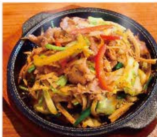
プルコギ 900 Grilled Beef and Vegetables 牛肉と野菜の特製醤油タレ焼き