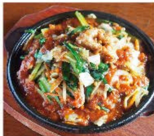
牛ホルモンのピリ辛炒め 950 Grilled Hot Beef Innards 牛ホルモンのコチュジャン焼き