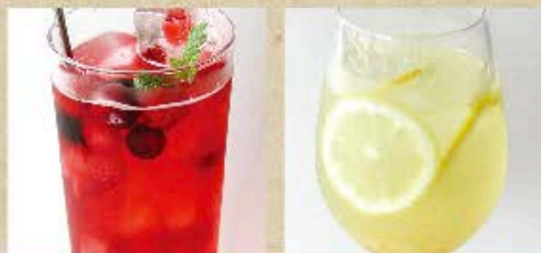
ザクロの ベリーティーソーダ Pomegranate Berry Tea Soda 580