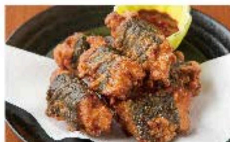
韓国海苔とチキンの挟み揚げ 750 Fried Korean Seaweed and Chicken 辛味のある特製タテギソースをお好みで。