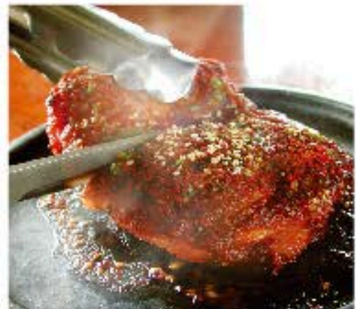
プルダ 1,000 Grilled Spicy Chicken 「火の鶏」という意味の、辛味焼きチキン。