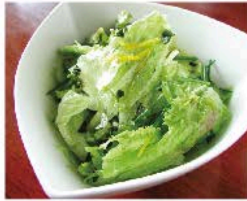
チョレギサラダ 730 Korean-style Green Salad