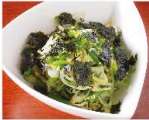
韓国海苔と青ネギのサラダ 690 Korean Dried Seaweed and Scallion Salad