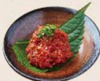
チャンジャ 450 Cod's Salted Fish Guts