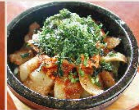
豚トロキムチ石焼ご飯 930 Baked Rice with Pork and Kimchi スープ付き