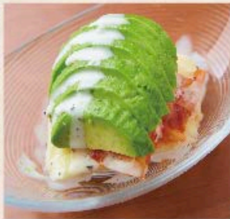
アボカドとキムチの冷菜 620 Avocado and Kimchi