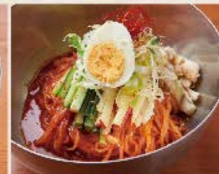
ビビン麺 950 Chilled Spicy Soup Noodle