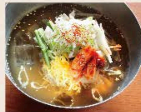
韓国冷麺 950 Chilled Chicken Soup Noodle