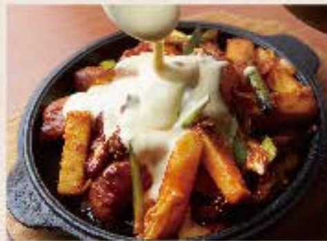
チーズダッカルビ 1000 Spicy Chicken BBQ with Cheese 甘辛のヤンニョムソースで炒めた鶏肉やトッポギをたっぷりチーズに絡めてどうぞ。