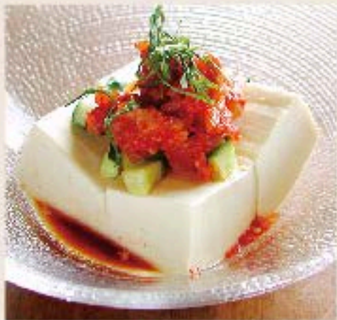
辛味冷や奴 520 Cold Tofu with Korean Hot Sauce