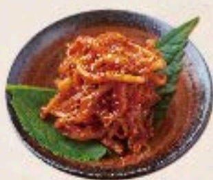
さきイカキムチ 450 Dried Squid Kimchi