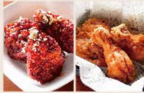
韓国風フライドチキン 580 Korean Fried Chicken