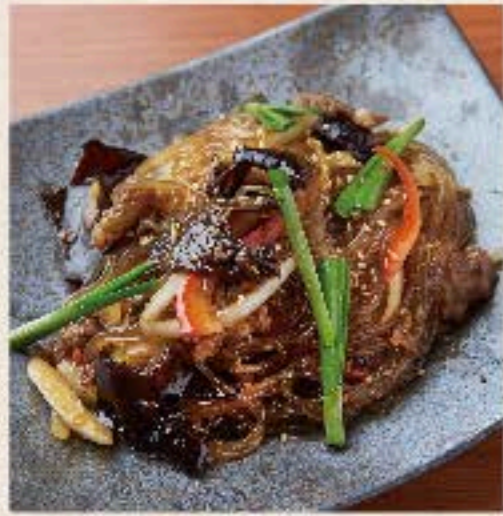
チャブチュ 720 Fried Bean-starch Vermicelli 春雨と野菜の、韓国を代表する家庭料理