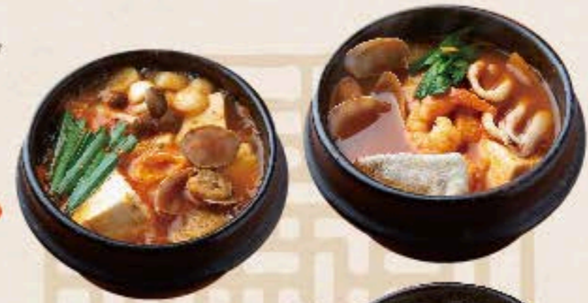
海鮮チゲ 1,200 Seafood Hot Pot