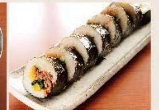
キンパ 650 Korean Rolled SUSHI