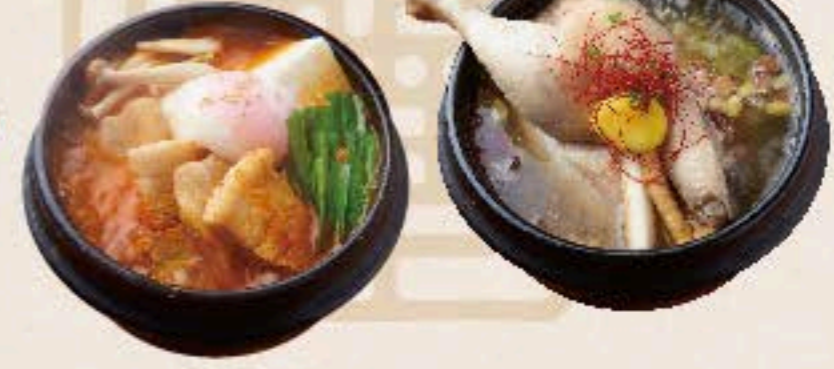
サムゲタン 1,680 Stuffed Chicken Pot もち米、高麗人参、ニンニグなどを詰めた鶏肉をトロトロに煮込みました。