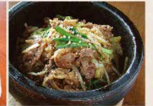
ブルコギ石焼ご飯 930 Baked Rice with Beef スープ付き