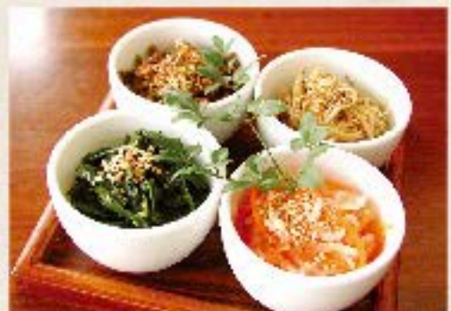
ナムル3品盛り合わせ 720 Assorted Namul