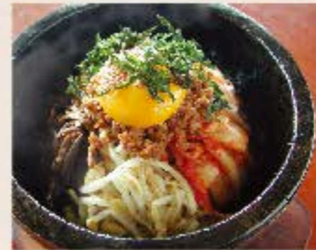
石焼ビビンバ 880 "Bibimbap" Baked Rice スープ付き