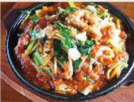
牛ホルモンのピリ辛炒め 950 Spicy Beef Innards BBQ コチュジャンベースのタレで炒めた牛ホルモンを熱々の鉄板で。