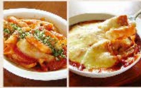
トッポギ 850 Fried Spicy Rice Cake 甘辛く炒めた韓国のお餅