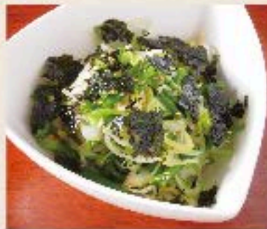
韓国海苔 180 Korean Dried Seaweed