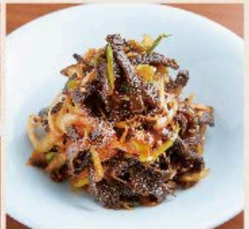
センマイと青ネギのピリ辛和え 650 Beef Omasum and Scallion seasoned Hot Sauce