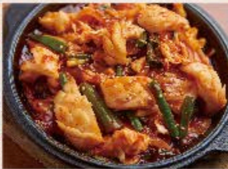
イカのピリ辛炒め 950 Squid & Vegetable spicy BBQ 甘辛いヤンニョムソースで、イカと野菜を炒めた、オジンオボックムという韓国料理。